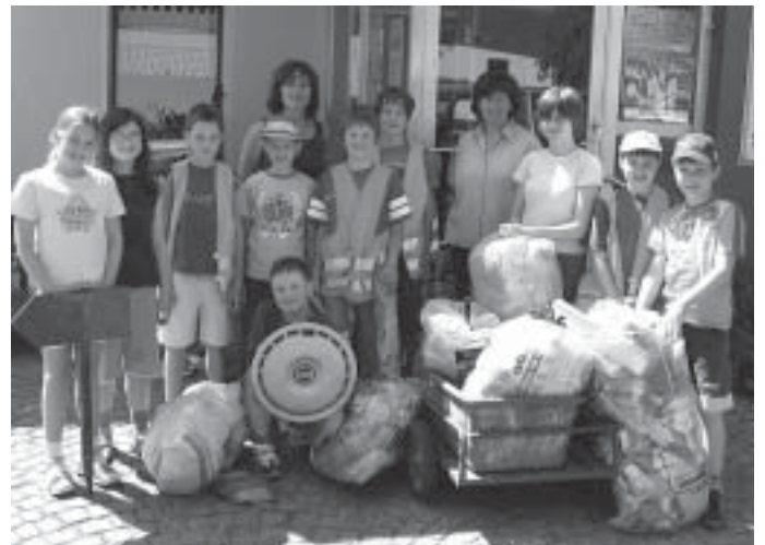
Das Bild zeigt die Truppe mit einem Teil ihrer „Beute“.