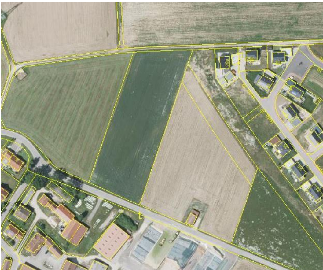
Abb.: Luftbild des Geltungsbereiches

Hinsichtlich des Landschaftsbildes ist eine erhebliche Vorbelastung zum einen durch die Biogasanlage vorhanden. Weiterhin beeinträchtigt auch die 220-kV-Freileitung das Landschaftserleben.